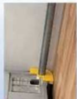
接触時の衝撃を緩和