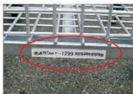
●機番管理しております